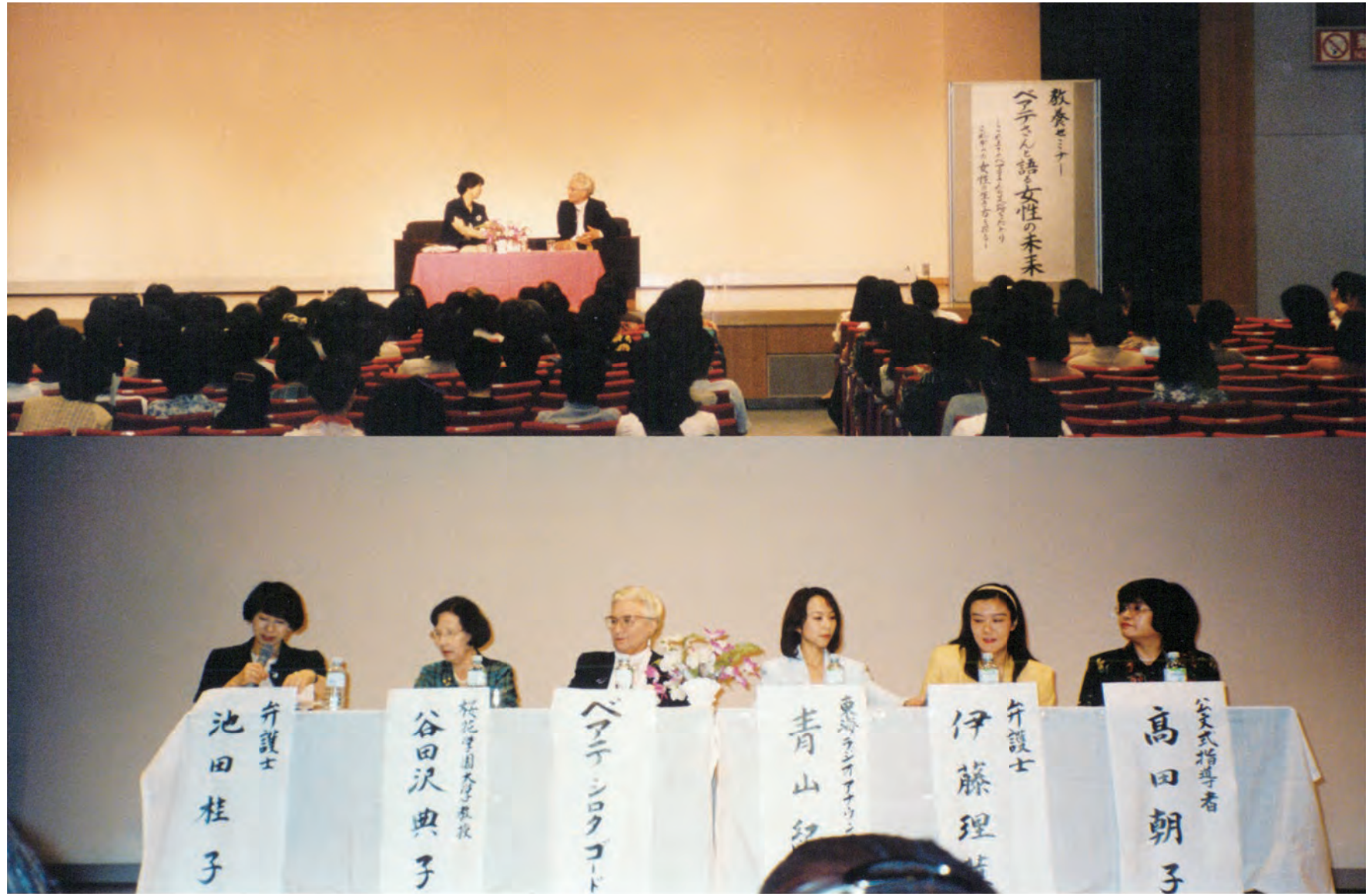
名古屋市鯉城ホールにて ベアテさんと語る女性の未来