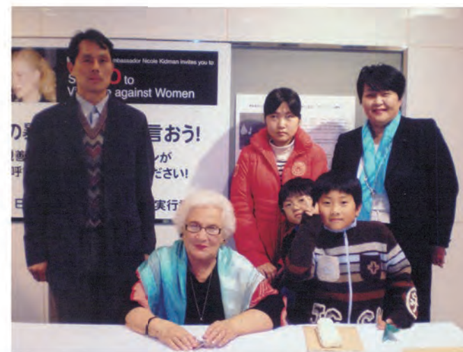
山口典子議員のご家族と