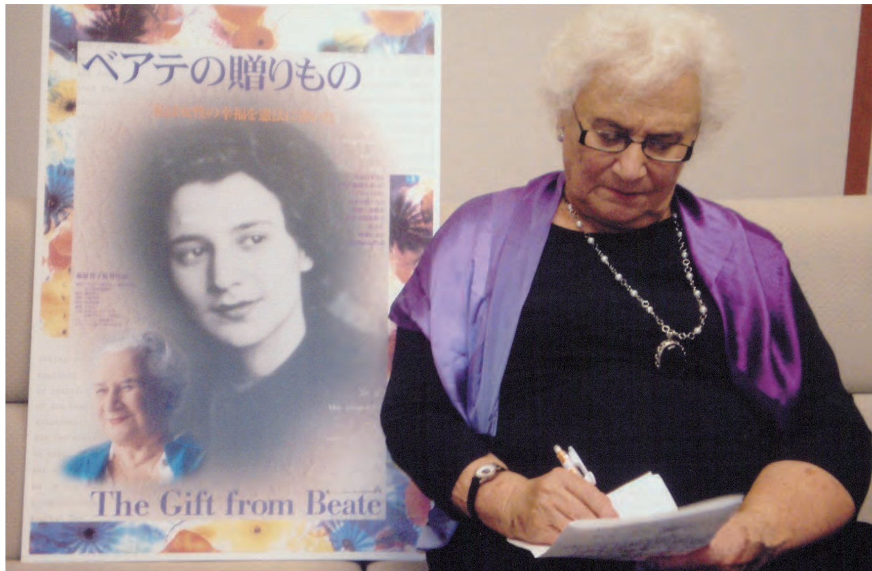
大阪堺市講演会 原稿チェック