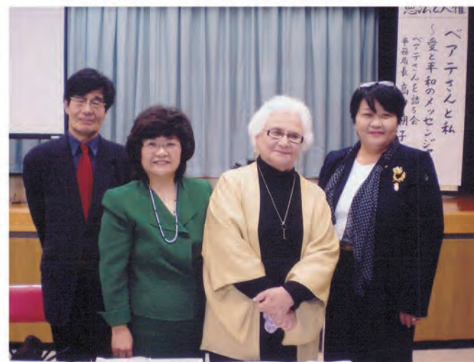
大阪堺市 女性会館にて 高田講演