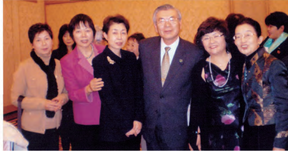
2008.12 大阪堺市表敬訪問