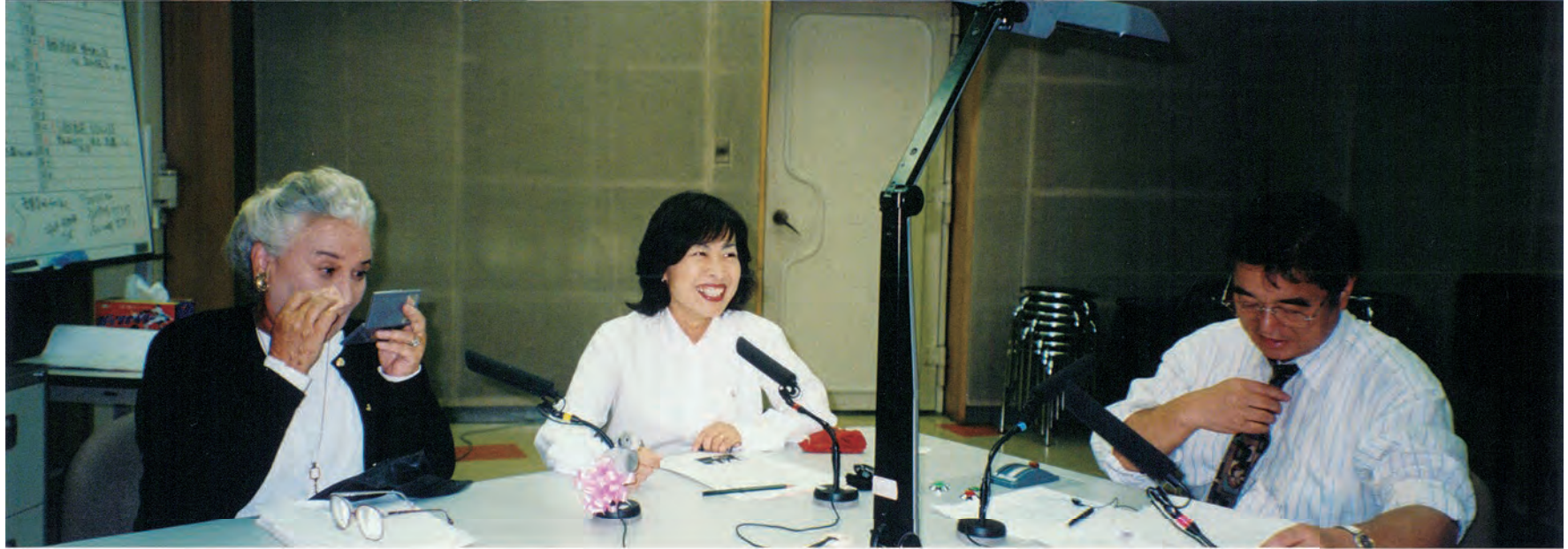
アマチンのラジオにおまかせ 出演