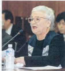
2009年5月、参院憲法調査会の参考人質疑で発言するベアテ・シロタ・ゴードンさん

【ニューヨーク】起草作業に携わり、男女平等に関する条項を起草したベアテ・シロタ・ゴードンさんが、10日、肺炎で死去した。享年89歳。米国憲法の起草に貢献した女性として知られる。ゴードンさんは、戦前、日本に渡り、戦後、米国に帰国し、憲法の起草作業に携わった。戦前、日本に渡り、戦後、米国に帰国し、憲法の起草作業に携わった。